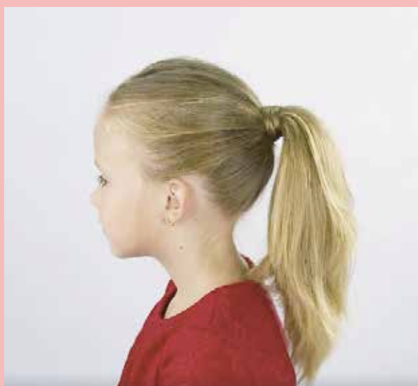
Queue de cheval tirée